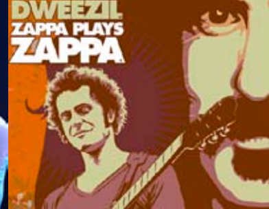
De gauche à droite: Dennis DeYoung • Edgar et ses fantômes • Emilie-Claire Barlow • Dweezil Zappa plays Zappa