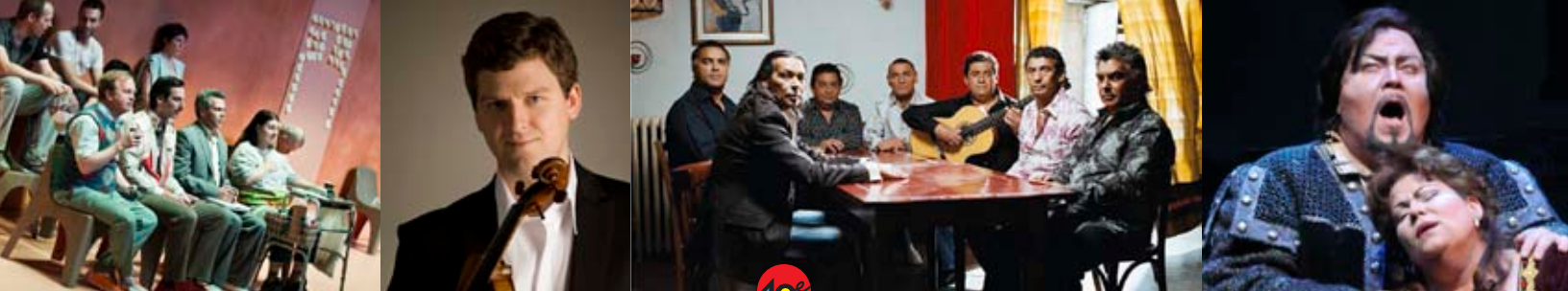
De gauche à droite: Kliniken • James Ehnes • Gipsy Kings • Il Trovatore – Opéra de Québec