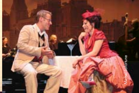
De gauche à droite : Boucar Diouf • Circa • Daniel Bélanger • C'est notre chanson

Comme on le sait, le Grand Théâtre évolue dans un marché hautement compétitif et en évolution constante. Or, plusieurs éléments nouveaux influencent directement les habitudes de consommation du citoyen : l'offre de plus en plus diversifiée de produits culturels et de divertissement, l'avènement du numérique dans le quotidien des clientèles, l'émergence des réseaux sociaux, le ralentissement économique et son impact sur le « dollar loisir » dont dispose le citoyen, pour ne nommer que ceux-là. La conjoncture créée par cet ensemble de facteurs sociaux, culturels et économiques se traduit par des transformations majeures du comportement des clientèles. À cet égard, nous devons tenir compte des tendances et des enjeux complexes qui déterminent le contexte dans lequel évolue le Grand Théâtre, afin de poursuivre une réflexion essentielle, ajuster nos orientations et développer de nouvelles pratiques qui nous permettront de demeurer compétitifs tout en respectant l'essence de notre mission.