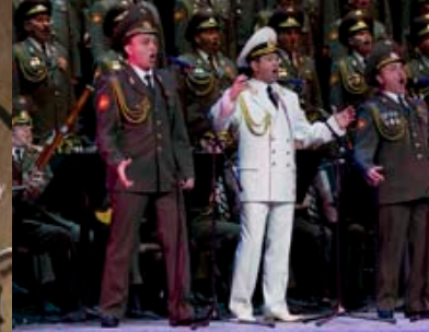
De gauche à droite: Hilary Hann • Émergence – Ballet national du Canada • Chœur de l'Armée rouge russe