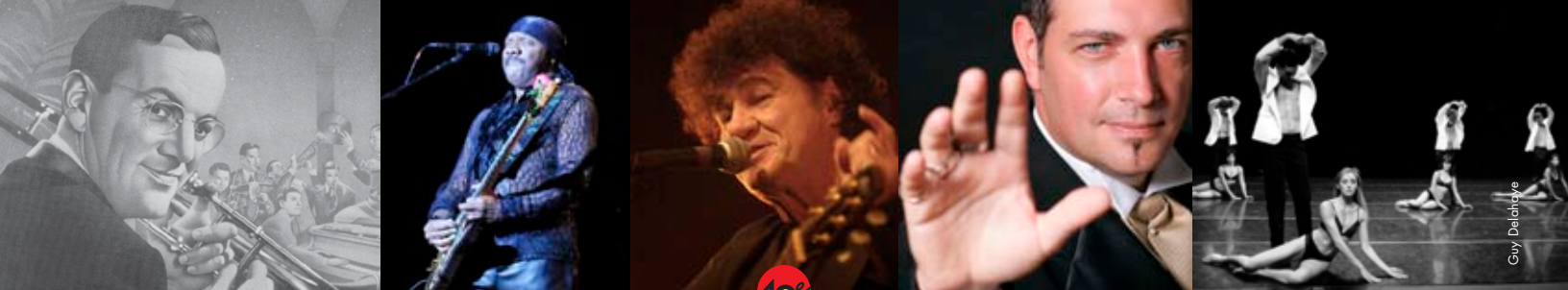
De gauche à droite: The Glenn Miller Orchestra • Experience Hendrix • Robert Charlebois • Messmer • L'Homme à tête de chou – Centre chorégraphique national de Grenoble