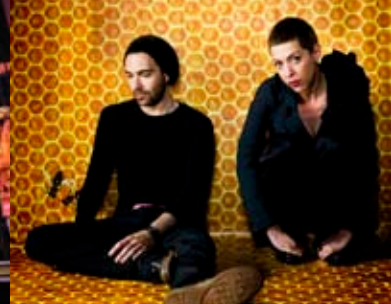
De gauche à droite : Alfa Rococo • La Chauve-Souris – Opéra de Québec • Beast

symphonique de Québec et du Théâtre du Trident. À toutes ces rencontres et découvertes, se sont ajoutées les causeries d'avant-spectacle, véritables rencontres de vulgarisation toujours aussi courues qui donnent la possibilité aux spectateurs de se familiariser avec des aspects méconnus des arts de la scène.