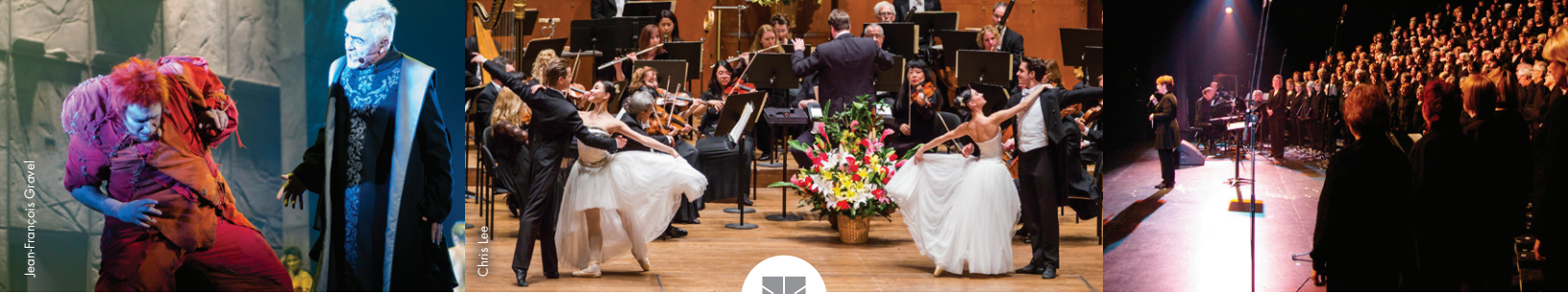
De gauche à droite: Notre Dame de Paris • Hommage à Vienne • Chœur en Supplément'Air