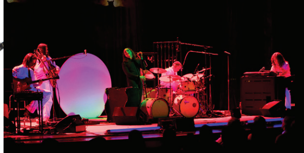
De gauche à droite : Le Ballet de Québec • Carrefour international de théâtre • Constantinople • The Musical Box