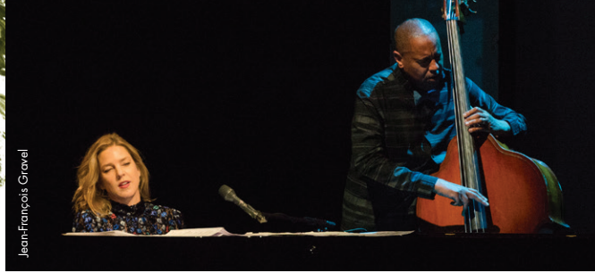
De gauche à droite : Les Quatre Saisons d'André Gagnon • k. d. lang • Diana Krall

Enfin, à la suite de démarches visant à renouveler l'offre d'hospitalité et à trouver un partenaire optimal pour maximiser le potentiel du projet, nous avons conclu une entente avec Le Cosmos, une entreprise solide et expérimentée dans l'opération de lieux liés à la présentation de spectacles. Ce nouveau partenaire sera en charge du service de brevages dans cet espace ainsi que dans l'ensemble du Grand Théâtre dès l'ouverture de la saison 2018-2019.